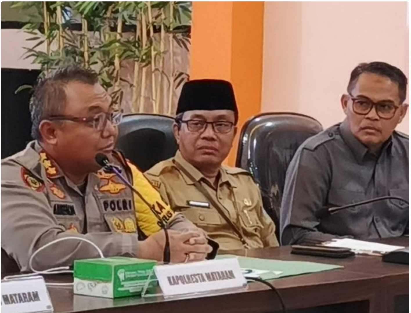
Kapolresta Mataram (Kiri) saat memimpin Konferensi pers akhir tahun, Selagi (31/12/2024)

MATARAM, NTB – Polresta Mataram mengakhiri tahun 2024 dengan menggelar Konferensi Pers Akhir Tahun, sebuah forum transparansi untuk memaparkan capaian dan inovasi yang telah dilakukan selama satu tahun. Kegiatan yang